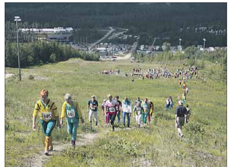
Paljakka sopii suunnistuskilpailujen järjestämiseen. Alueella on monipuolinen maasto ja kilpailukeskuksen tarvitsema infrastruktuuri.