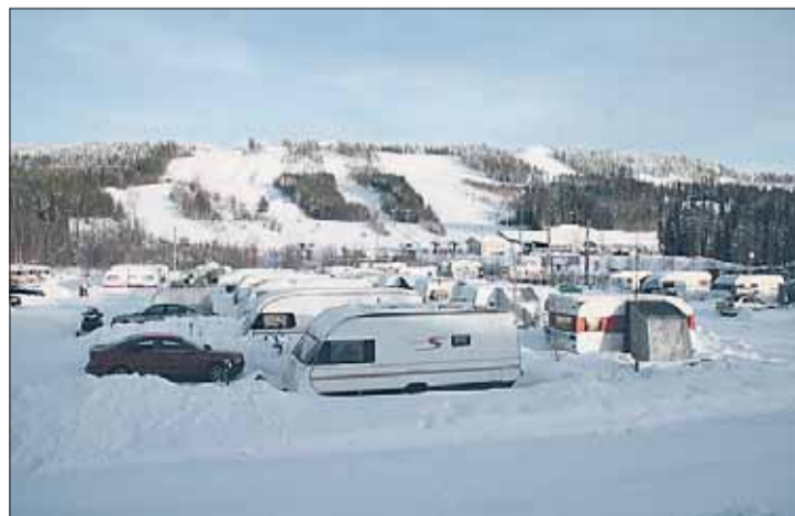
Vuoden 2007 karavaanarialueeksi valittu Paljakan hiihtokeskus on ykköstuotteensa laskettelun rinnalla panostanut myös muihin palveluihinsa.