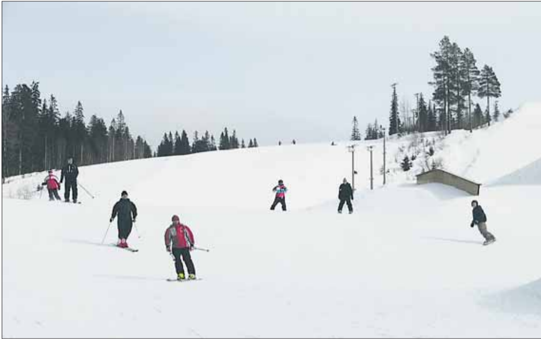
Paljakan rinteissä viihtyvät monentasoiset ja -ikäiset laskijat.

Paljakan hiihtokeskus palvelee laskettelijoita ja lautailijoita 17 huipukuntoisella rinteellä, seitsemällä hissillä ja monipuolisilla lastenrinteillä.