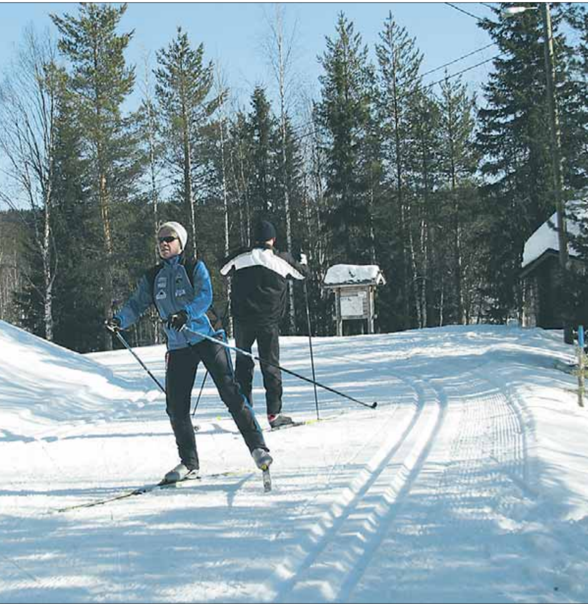
matkailukeskuksen peruspalveluja laskettelun ohella. Paljakan alueella onkin yli 140 kilometriä latuja. Aluetta, ja lunta riittääkin varhaisesta syksystä myöhään kevääseen saakka.