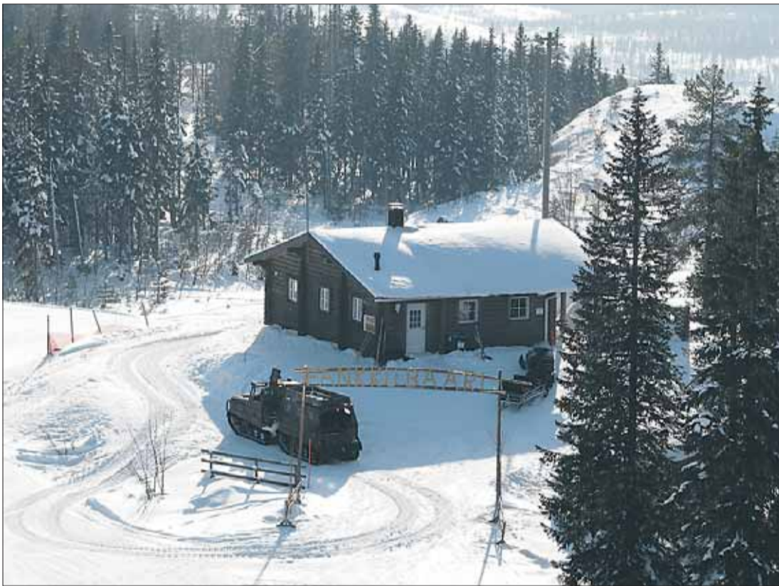
Paljakan rinteiden yläosassa sijaitsevan Pankkubaarin nimi juontuu siitä, että kuljetus baariin ja sieltä takaisin tapahtuu armeijan vanhalla telakuorma-autolla.

Tiedustelut: Hiihtokeskus Paljakka Oy Puh. (08) 755 120