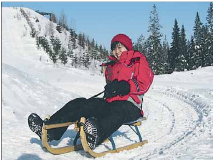
Paljakassa pääsee laskemaan yli kilometrin matkan alas huikaa jalaskelkkamäkeä.

1200 metriä pitkä rata mutkittelee mahtavien maisemien saattamana Pankkubaarin nurkilla Skibörrin edustalle. Vastaavanlaista